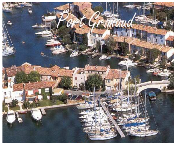
Grand bain de soleil avant